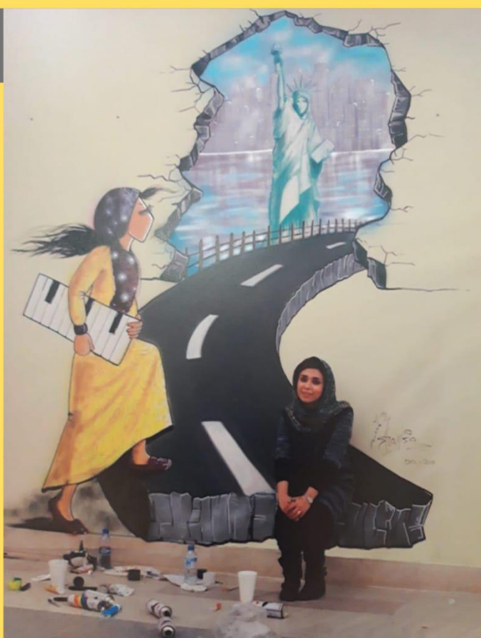
particolare foto opera di Shamsia Hassani

Sul tema della difesa dei diritti violati in ogni parte del mondo e in particolare in difesa dei diritti delle donne, la mostra propone pannelli che riproducono opere realizzate dalla street artist afgana Shamsia Hassani ( https://www.shamsiahassani.net ), la prima artista di graffiti donna dell'Afghanistan. Attraverso le sue opere, Shamsia ritrae le donne afgane in una società dominante maschile. "L'arte cambia la mente delle persone e le persone cambiano il mondo."