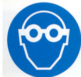
proteggere gli occhi