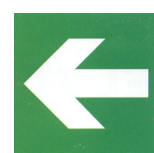
freccia di direzione