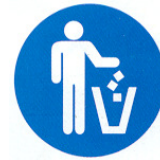
versare i rifiuti nei contenitori appositi