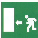
direzione uscita d'emergenza