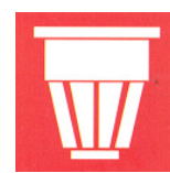
rivelatore di fumo