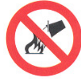
divieto di spegnere con acqua