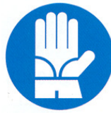
guanti di protezione