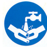
lavarsi le mani