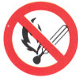
vietato fumare e/o usare fiamme libere